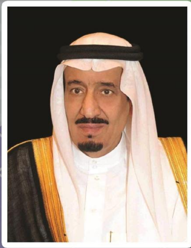
خادم الحرمين الشريفين الملك سلمان بن عبد العزيز آل سعود ملك المملكة العربية السعودية